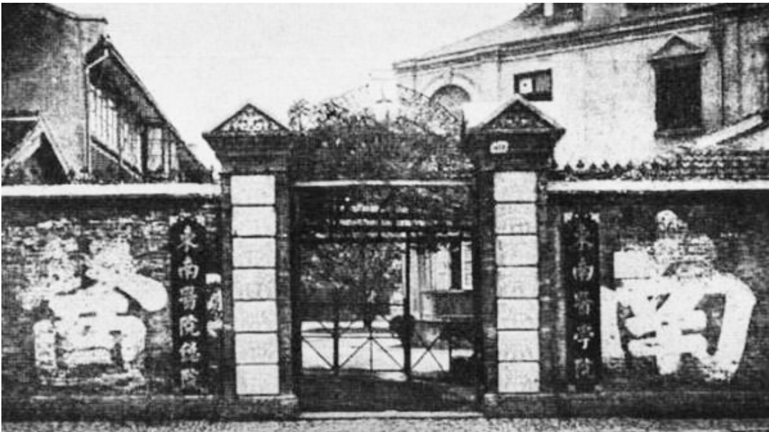
东南医院总院大门