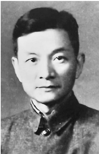
东南医院首任院长汤鑫舟